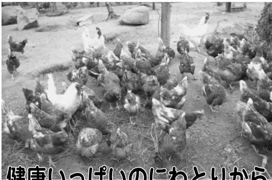
旭愛農生産組合で飼われている元気な鶏たち。

高校再編により3月末で流山東高校がなくなりました。県教育委員会は、特別支援学校流山高等学園の規模を現在の1学年45人(全校135人)から1学年120人(全校360人)に増やし、1年生と2年生が利用する第2キャンパスとして東高校の跡施設を利用することを決めました。2008年度は耐震補強工事、2009年度は改修工事を行うため2010年4月